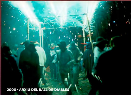
2000 · ARXIU DEL BALL DE DIABLES