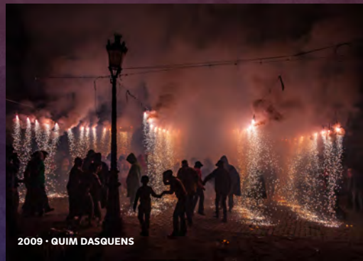
2009 · QUIM DASGUENS