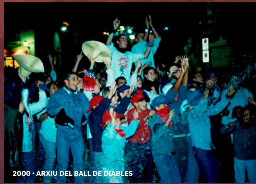
2000 · ARXIU DEL BALL DE DIABLES